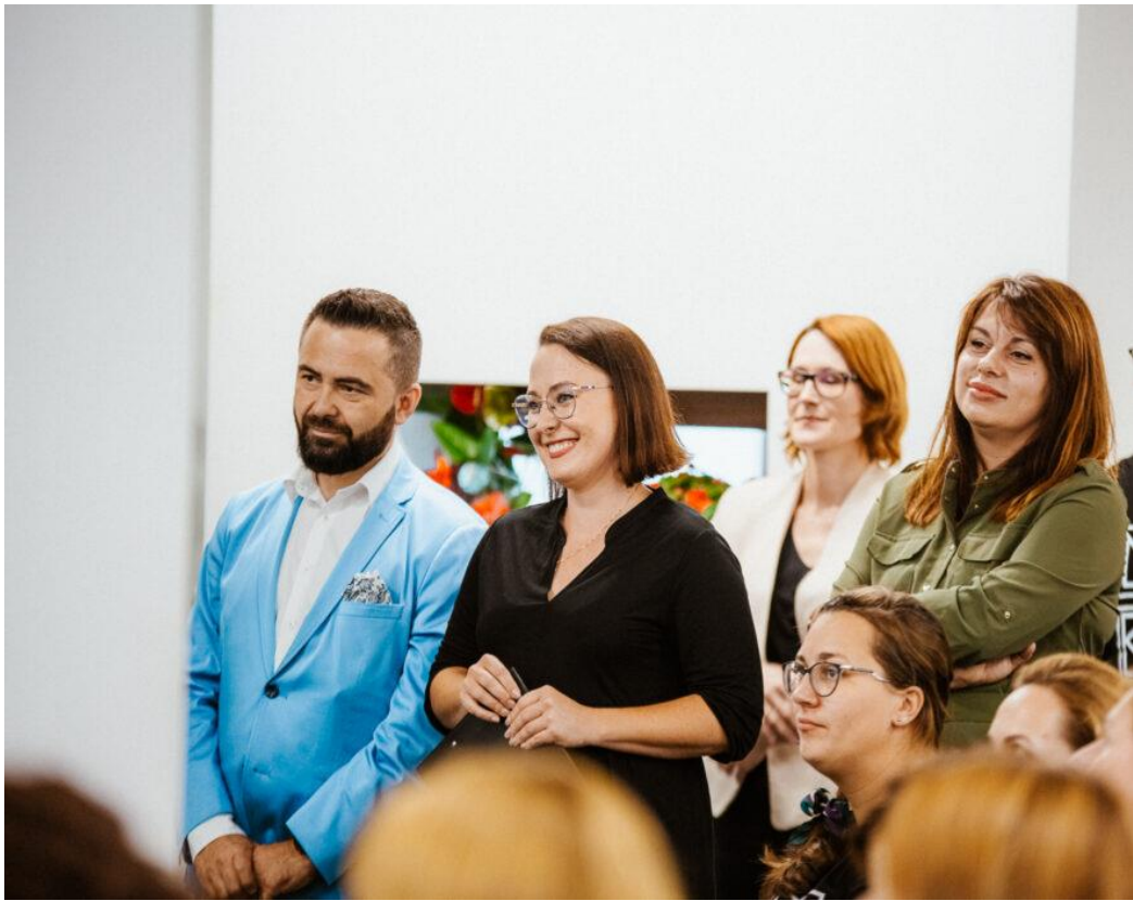
Centrum Aktywności Społecznej – 1. urodziny