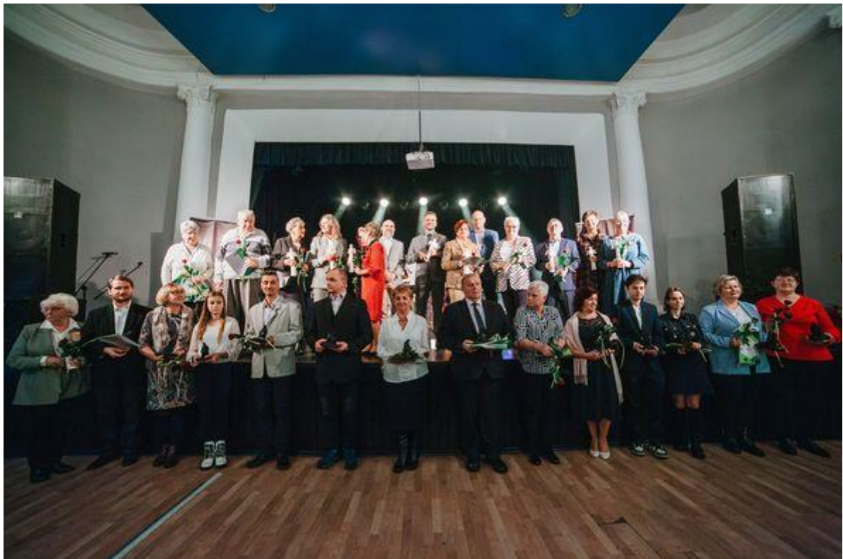
Gala Wolontariatu 2023