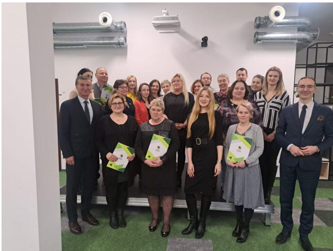
Wręczenie listów gratulacyjnych dla organizacji, które w 2023 r. realizowały zadania publiczne oraz podziękowań dla członków komisji, którzy oceniali wnioski.