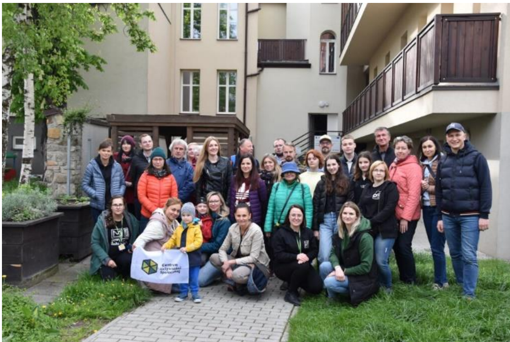
Centrum Aktywności Społecznej – Grill Społeczny