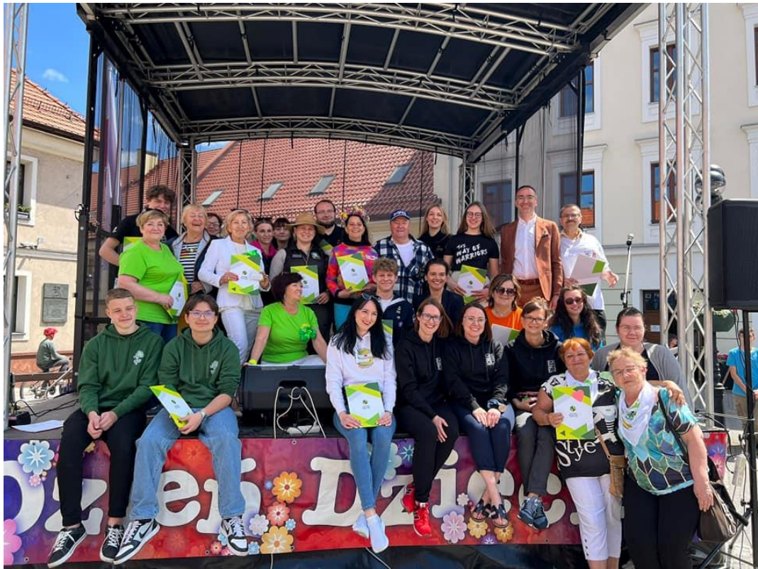
Dzień Aktywności Społecznej 2023