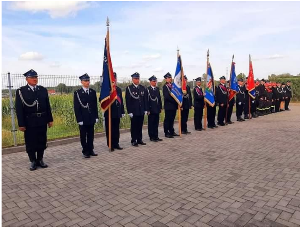
Związek Ochotniczych Straży Pożarnych RP Zarząd Oddziału Miejskiego w Mikołowie – realizacja zadania publicznego pn.: „Bezpieczeństwo na 1 miejscu”