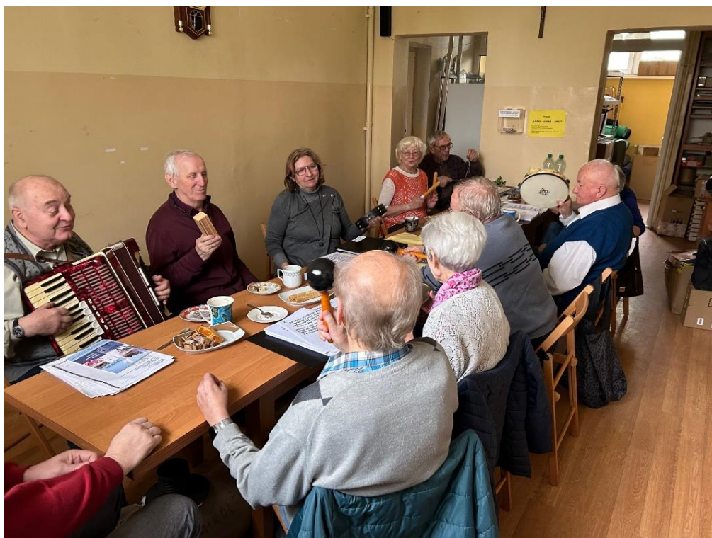
Polski Związek Niewidomych Okręg Śląski Koło w Mikołowie - realizacja zadania publicznego pn.: „Obrazy, Słowa, Dźwięki”.