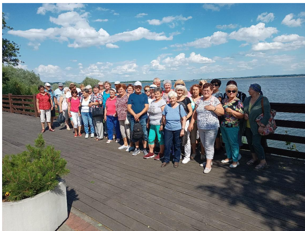
Fundacja Zakątek Pokoleń – realizacji zadania publicznego pn.: „SPA Senior – zajęcia rekreacyjne dla mikołowskich seniorów”