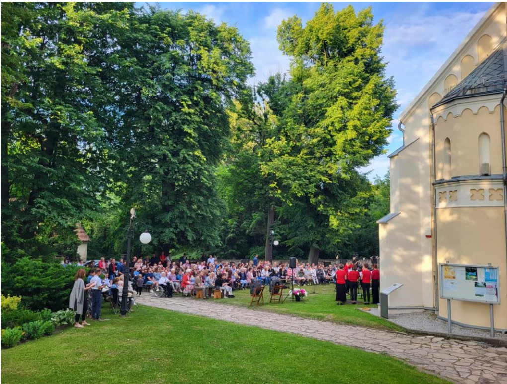
Mokierskie Stowarzyszenie Muzyczne – realizacja zadania publicznego pn.: „Cantiamo tutti – Mokierski Chór Kameralny 2023”