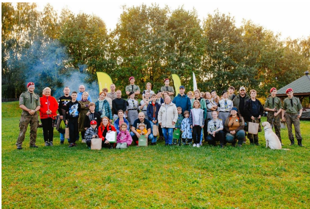
Związek Harcerstwa Polskiego Chorągiew Śląska Komenda Hufca Ziemi Mikołowskiej – realizacja zadania publicznego pn. „Razem lepiej – spotkania pokoleń”.