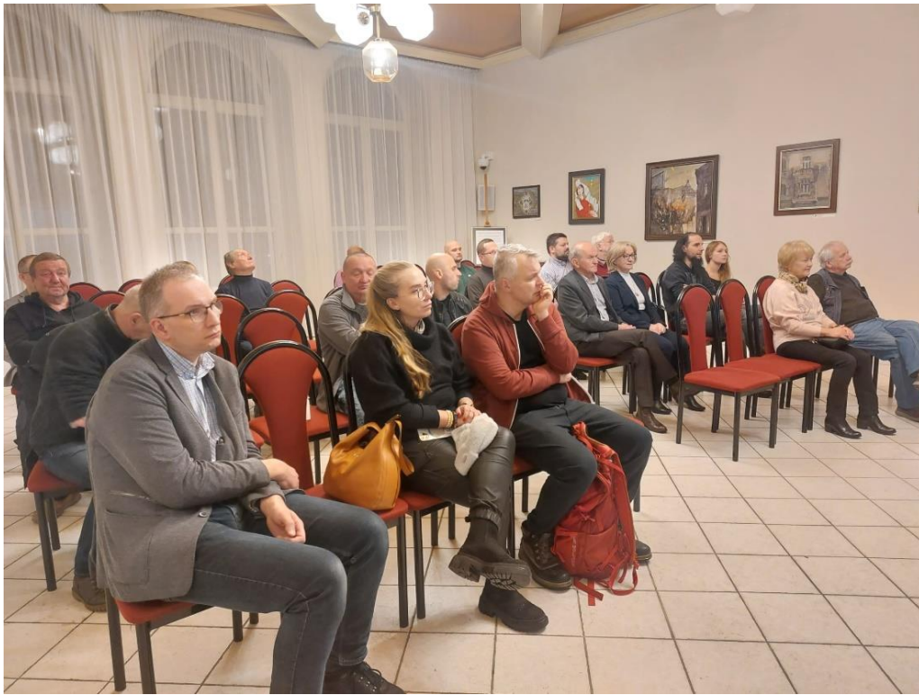
Mikołowskie Towarzystwo Historyczne – realizacja zadania publicznego pn.: „Mikołów – niezapomniana historia”