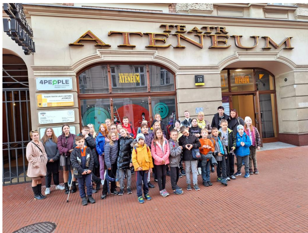
Stowarzyszenie Uśmiech - realizacja zadania publicznego pn. „Skrzydlate Anioły”.